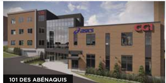
101 DES ABÉNAQUIS

IMMOBILIER | FINANCEMENT | INVESTISSEMENTS