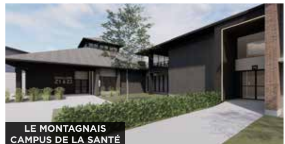
LE MONTAGNAIS CAMPUS DE LA SANTÉ