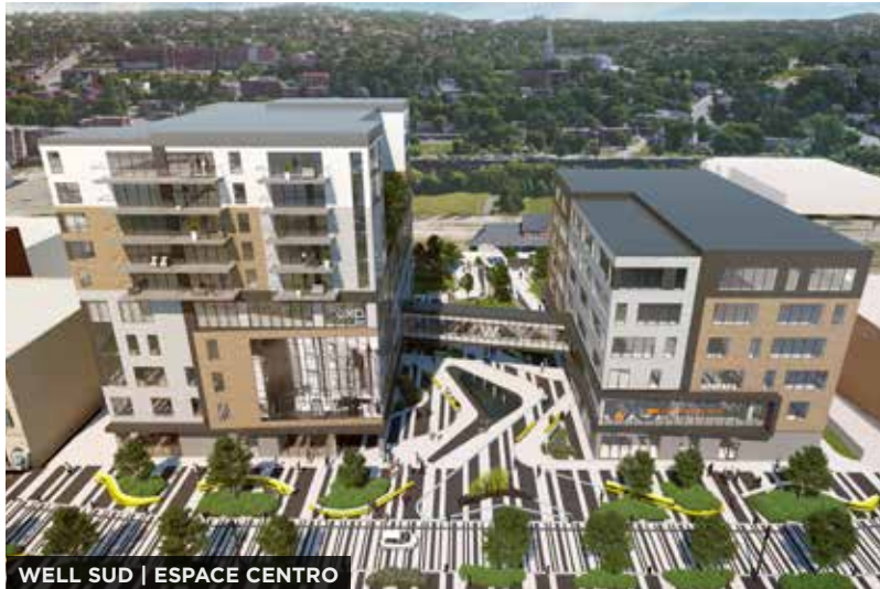
WELL SUD | ESPACE CENTRO