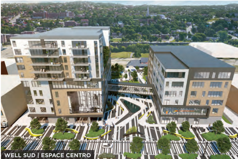
WELL SUD | ESPACE CENTRO

IMMOBILIER | FINANCEMENT | INVESTISSEMENTS