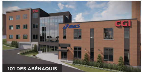
101 DES ABÉNAQUIS