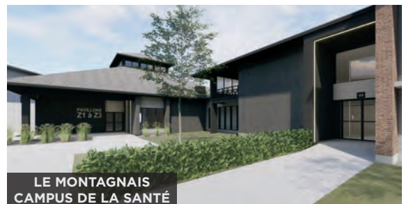
LE MONTAGNAIS CAMPUS DE LA SANTÉ